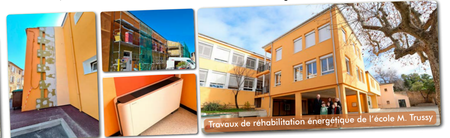
Travaux de réhabilitation énergétique de l'école M. Trussy

On peut citer également, après la réhabilitation énergétique de l'école Marius Trussy, effectuée en 2022, l'étude de réhabilitation en cours de l'école André Négrel.